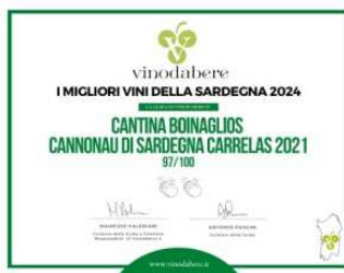
Cannonau di Sardegna, Nepente di Oliena Boinaglios